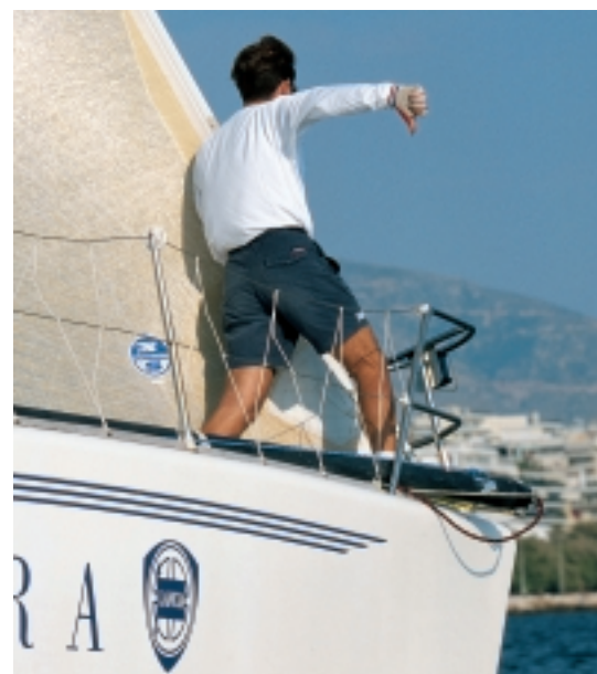
Αντήχειρας κάτω: Πρέπει να ποδίσουμε, περνάμε τη γραμμή.