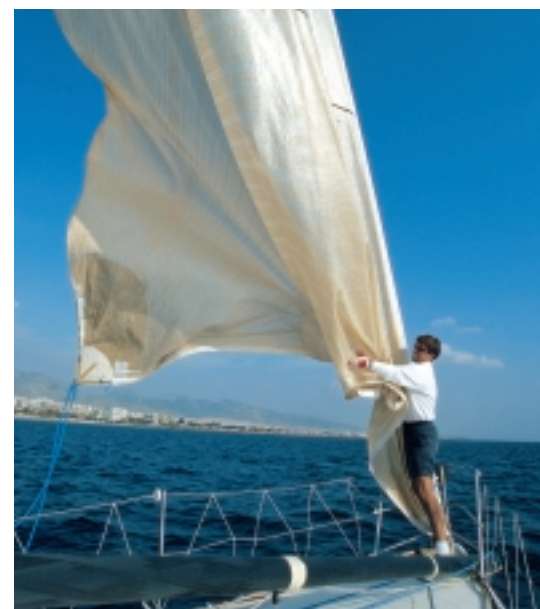
Ο πλωριός θα χρειαστεί να μαζέψει γρήγορα την τζένοα στην πλήρη, έτσι ώστε να επιβραδύνει το σκάφος, χωρίς να υπάρχει ο κίνδυνος της ανακωχής.