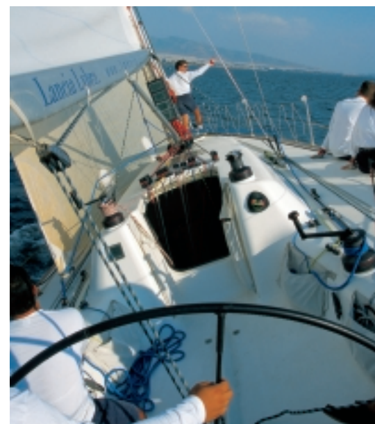
Είναι πολύ χρήσιμο, κατά τη διάρκεια της εκκίνησης, να μετράμε την ταχύτητα σε μέτρα / δευτερόλεπτο και όχι σε μίλια / ώρα, έτσι ώστε να υπολογίζουμε την απόσταση.