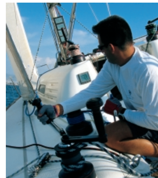
Το σκάφος πρέπει να κινείται συνεχώς με τη μέγιστη ταχύτητα και το πλήρωμα να τριμάρει συνεχώς. Με αυτόν τον τρόπο ο τιμονιέρης μπορεί να υπολογίζει την