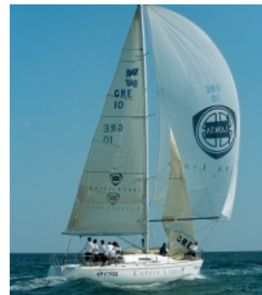
Η τζένοα είναι πάντα απαραίτητη στην εκκίνηση και πρέπει να κατεβαίνει αμέσως μετά.

Στις εκκινήσεις που είναι πρύμα, είναι πολύ σημαντικό τα σκάφη να κινούνται στο προπορασκευαστικό διάστημα με την τζένοα. Υπάρχουν δύο βασικοί λόγοι για αυτό. Ο πρώτος είναι ότι εάν το σκάφος ήταν μόνο με μαστίρα θα είχε σαφώς μικρότερη ικανότητα ελιγμών και θα δυσκολευόταν να φτάσει στη γραμμή στο σημείο που θα ήθελε έγκαιρα. Επίσης, τα σκάφη που θα είχαν και τα δύο πανιά θα μπορούσαν να το «ελέγξουν» εύκολα. Τέλος, ένα θέμα πρακτικής που δεν πρέπει ποτέ να αγνοούμε είναι ότι το βίρα του μπολονιού είναι πάντα πιο εύκολο και πιο ακίνδυνο όταν έχουμε πάνω την τζένοα.