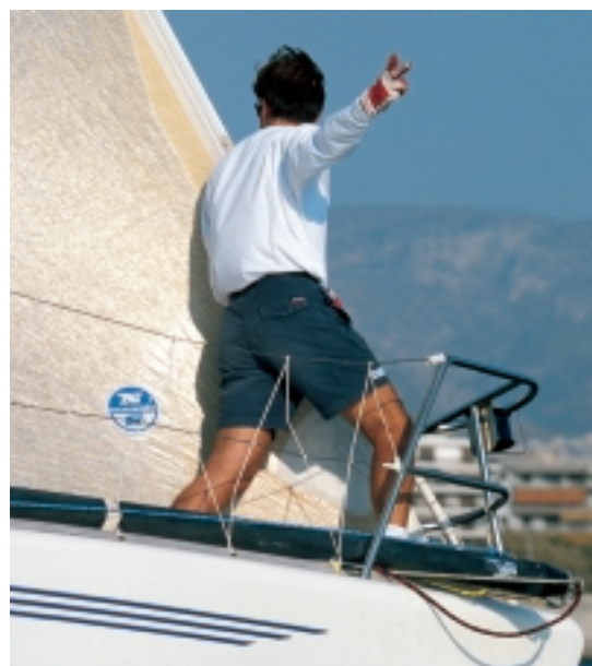
Απόσταση από τη γραμμή δύο «σκαφίς». Ο τιμονιέρης συνήθως έχει περιορισμένη ορατότητα και δεν μπορεί να ελέγξει τι ακριβώς γίνεται σταβέντο του.

Δεν υπάρχει τίποτα πιο άκομφο από ένα πλήρωμα στο οποίο επικρατούν φωνές. Προκειμένου να μην υπάρχει σύγχυση, ο πλωριός στην εκκίνηση πρέπει να συνεννοείται με τους πίσω μόνο με νοήματα, τα οποία πρέπει να έχουν προκαθορίσει. Δεν υπάρχει κάποια παγκόσμια μέθοδος, αλλά το κάθε πλήρωμα υιοθετεί τα δικά του σήματα.