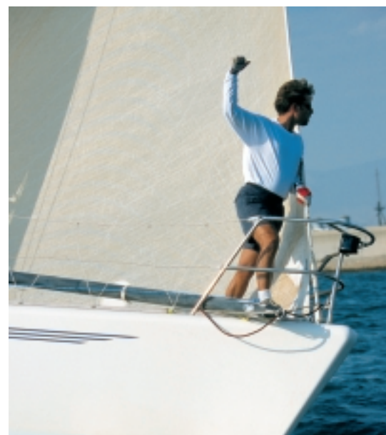
Χέρι σε ορθή γωνία: Είμαστε ακριβώς πάνω στη γραμμή.