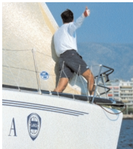
Αντήχειρας πάνω: Μπορούμε να ανέβουμε, είμαστε κάτω από τη γραμμή.

Εάν η σηματοδούρα είναι δεξιά της πλήρης, τότε είστε ακόμα μέσα, εάν είναι αριστερά έχετε περάσει τη γραμμή. Στην περίπτωση πάντως που δεν υπάρχουν σημάδια, καλό είναι να ελέγξετε από πριν στην επιτροπή ποιος πρόκειται να πάρει την ευθυγράμμιση και να σημειώσει τους πρόωρους. Όσο δε βρίσκεστε στην ευθεία του, μπορείτε να αισθάνεστε ασφαλείς. Αυτό ισχύει ιδιαίτερα στη σηματοδούρα, όπου την ευθυγράμμιση την καθορίζει το φουσκωτό της επιτροπής. Στο επόμενο τεύχος θα δούμε πώς προσδιορίζουμε το κατάλληλο άκρο βάσει της διεύθυνσης του ανέμου. ☐